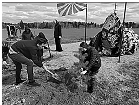
Работы по благоустройству «Поля памяти»

Мемориальный комплекс «Поле Памяти» под Вязьмой обладает особым значением для современного казачества Смоленщины, органично вписываясь в систему ценностей служения Отечеству, которая составляет стержень казачьей идентичности. Казаки Вяземского хуторского казачьего общества, студенты-казаки Университетского хуторского казачьего общества и ученики кадетского класса МБОУ Кайдаковская СОШ принимают активное участие в благоустройстве «Поля памяти» и казачьего погоста, расположенных в д. Красный Холм Вяземского района.