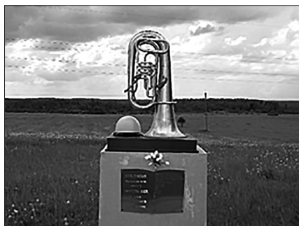
Мемориальный комплекс «Поле памяти»