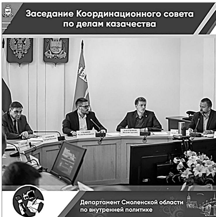
Заседание координационного совета по делам казачества Смоленской области 1

ношении российского казачества на территории Смоленской области; координация деятельности органов исполнительной власти Смоленской области и казачьих обществ по вопросам, касающимся экономического и социального развития казачьих обществ, сохранения и развития казачьих традиций и культуры, а также патриотического воспитания молодежи; подготовка предложений Правительству Смоленской области по вопросам государственной поддержки казачьих обществ и реализации казачьих инициатив.