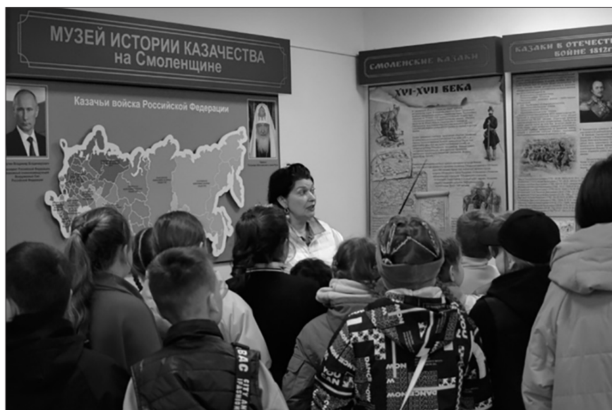
Экскурсия в Музее истории казачества на Смоленщине