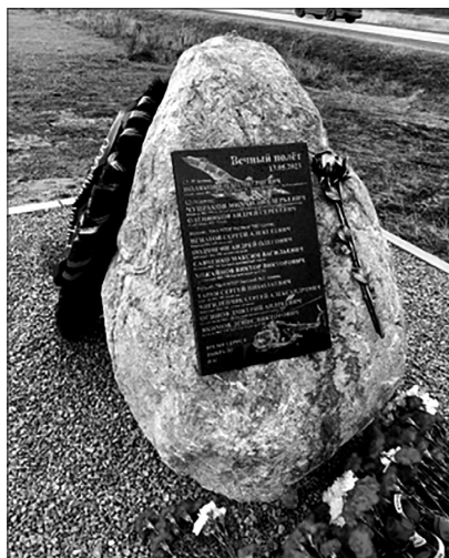
Мемориал, посвящённый лётным экипажам, погибшим в ходе СВО

мемориалу. Теперь это место станет центром памяти, куда будут приходить потомки, чтобы почтить героев и сохранить в сердцах свет их доблести и самоотверженности.