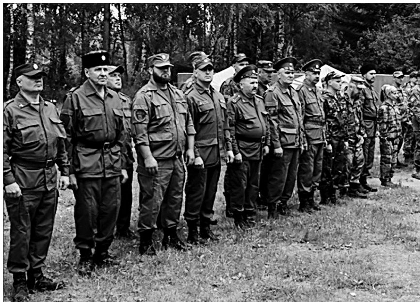
Смоленское отдельское казачье общество

По состоянию на конец 2024 г. в Смоленской области численность казачьих обществ и общественных объединений казаков составила 17 единиц, в т.ч. внесенных в государственный реестр казачьих обществ Российской Федерации – 12 единиц. Численность казаков в Смоленской области составляет 643