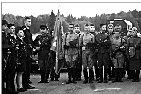
День Памяти и Скорби 22 июня в 4 часа утра на «Поле памяти»